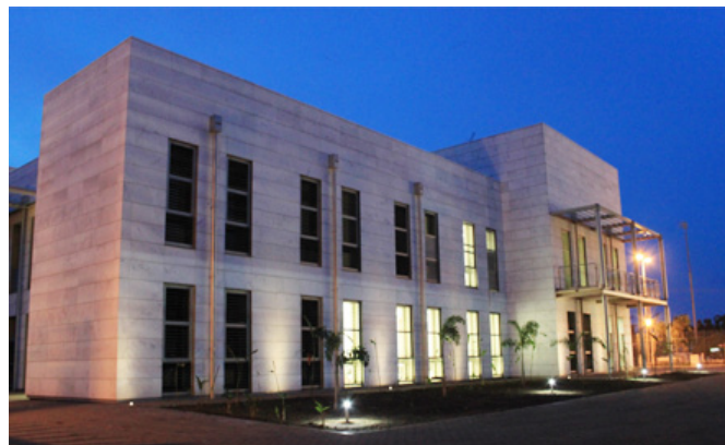
Imagen del nuevo edificio de la Embajada de España en Malabo, inaugurado en julio de 2011.

Guinea Ecuatorial ha evolucionado en los últimos años desde una posición de retraimiento hacia una mayor implicación en los asuntos internacionales, sobre todo africanos. Guinea Ecuatorial es miembro de las Naciones Unidas y de la mayoría de sus organismos especializados. En el entorno africano, pertenece a la Unión Africana, a la Comunidad Económica y Monetaria de África Central