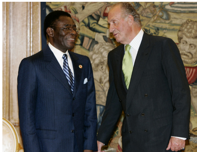
S.M. el Rey Juan Carlos, junto al Presidente de Guinea Ecuatorial, Teodoro Obiang, en el Palacio de la Zarzuela durante su última visita oficial a España en noviembre de 2006.

El XI Acta de Comisión Mixta previó una serie de actuaciones en materia de Asuntos Exteriores y Cooperación, Justicia, Implementación del Plan Nacional de Desarrollo Económico, Función/Administración Pública y Descentralización, que no han sido desarrolladas plenamente hasta ahora. En Justicia, una Misión de expertos del CGPJ español y el Ministerio de Justicia concluyó con una propuesta de formación en materia de medicina forense que está siendo financiada